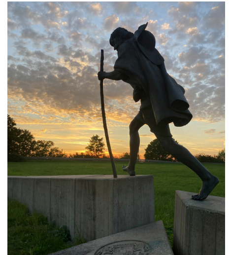
©Bild: Stefanie Kröner (Fotografie) / Hanspeter Widrig (Skulptur) In: Pfarrbriefservice.de

nen auch nur einen Becher frisches Wasser zu trinken gibt, weil es ein Jünger ist – Amen, ich sage euch: Er wird gewiss nicht um seinen Lohn kommen.