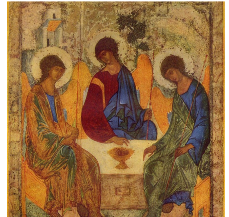
Andrej Rublev, Dreifaltigkeitsikone ©Wikipedia, gemeinfrei

18 Wer an ihn glaubt, wird nicht gerichtet; wer nicht glaubt, ist schon gerichtet, weil er nicht an den Namen des einzigen Sohnes Gottes geglaubt hat.