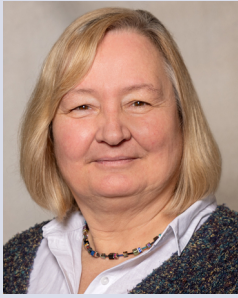
von Christiane Kreiß

Es ist schon faszinierend: ängstlich halten sich die Jüngerinnen und Jünger gemeinsam in einem Raum auf, in Jerusalem, betend, hoffend, dass niemand kommt und sie verhaftet. Und plötzlich gehen sie raus, sprechen zu den Menschen, und die Menschen verstehen sie und niemand versucht, sie zu verhaften. Was ist da passiert? In der Bibel heißt es: das war der Heilige Geist.