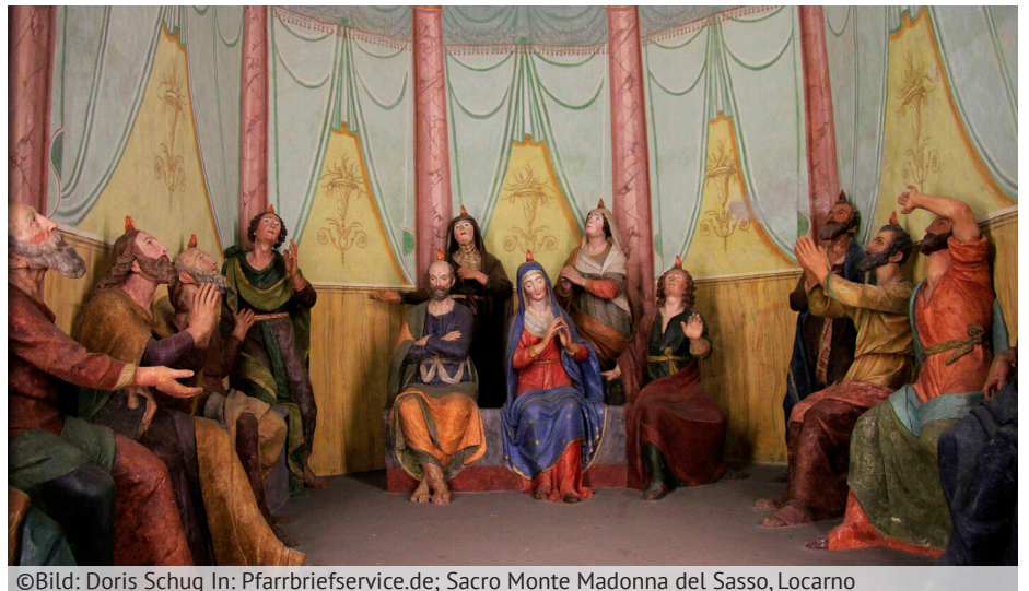
Sacro Monte Madonna del Sasso, Locarno

23 Denen ihr die Sünden erlasst, denen sind sie erlassen; denen ihr sie behaltet, sind sie behalten.