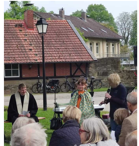
Himmelfahrt 2023 in Altenrode

Am Nachmittag gibt es in Altenrode auf der Wiese eine ökumenische An- dacht um 15.30 Uhr mit ansch- ließendem Kaffeetrinken.