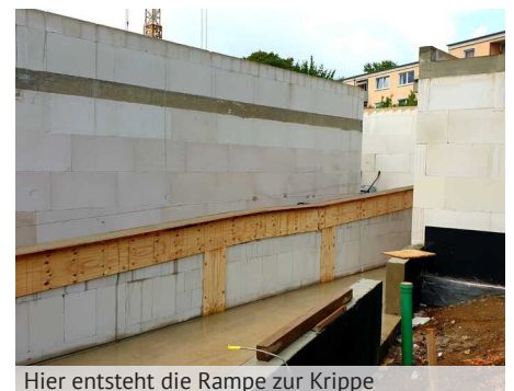
Hier entsteht die Rampe zur Krippe