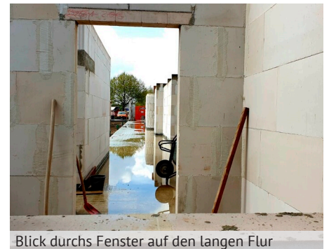
Blick durchs Fenster auf den langen Flur