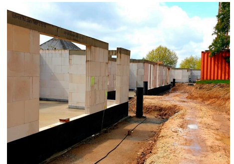
Ansicht von Norden auf die Gruppenräume