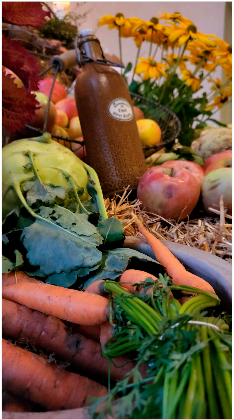
Detail Erntedankaltar St. Joseph