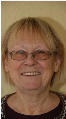
von Barbara Witczak